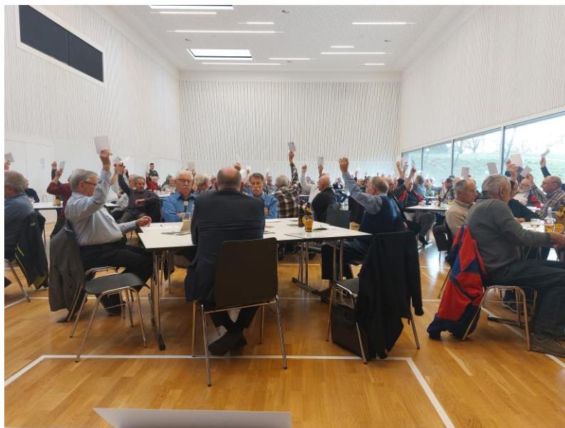
Gut besetzte Versammlung